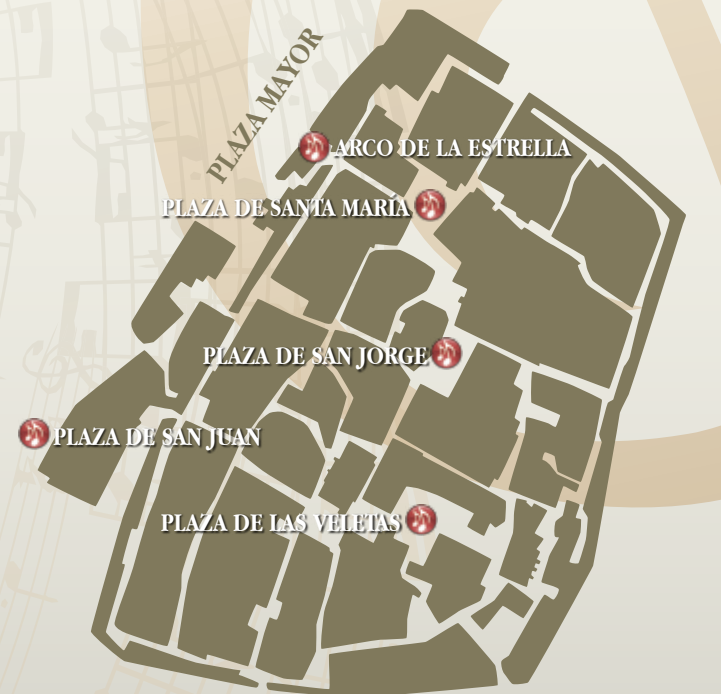
Ciudad Monumental de Cáceres

13.30 h · Plaza de San Juan Grupo de Saxofones