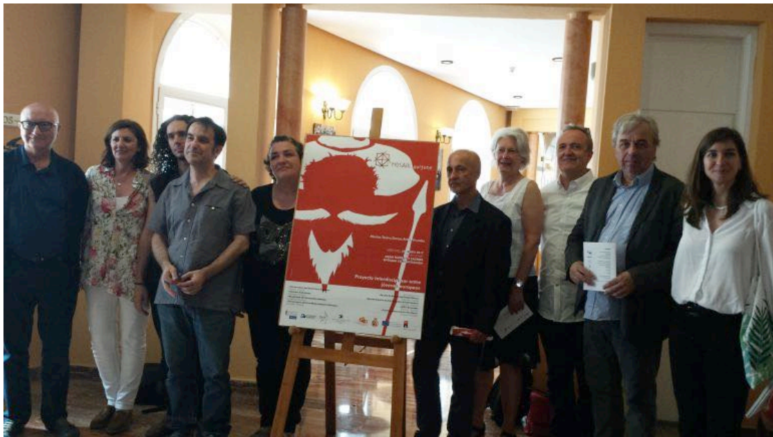
Representes del proyecto Erasmus+ "Mosaik" en la presentación del espectáculo

Alumnos de Cáceres, Clamart (Francia), Hammarö (Suecia) y Lüneburg (Alemania) participan en un proyecto europeo “Erasmus+”